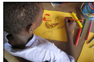
Quelques illustrations des élèves de Mopti extraites du conte Mali Malin Mélo