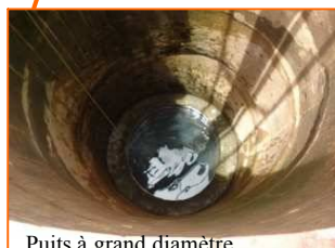
Puits à grand diamètre

Le Projet "Amélioration de l'accès à l'eau potable et à l'hygiène dans sept villages de la commune rurale de Fakala cercle de Djenne, région de Mopti" s'inscrit dans le cadre du Programme d'Appui Local de Mopti.