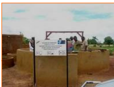
Puits avec aire de protection