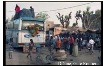
Djenné, Gare Routière

la composante « La Lutte contre le VIH- SIDA » ont été retenues sur les axes routiers Bamako- Bandiagara et Ségou-Tombouctou.