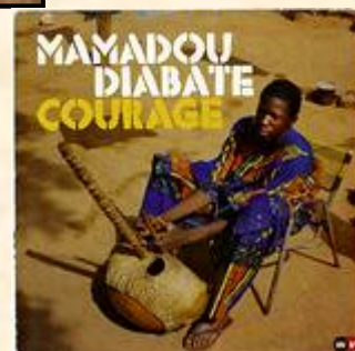
Le cinquième opus du plus décalé des koristes de la scène malienne actuelle.