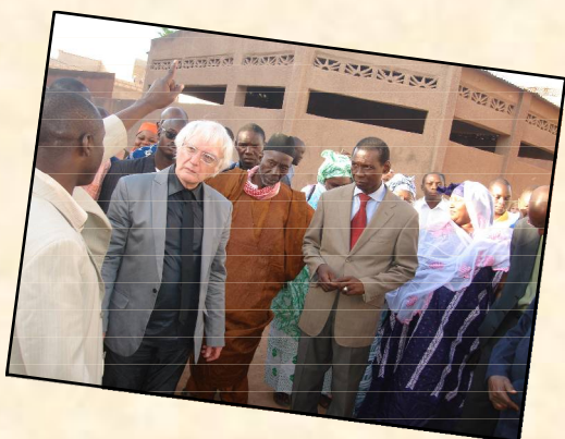
25ème anniversaire d'Action-Mopti