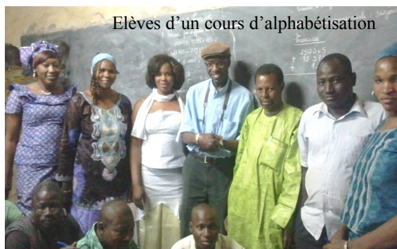
Elèves d'un cours d'alphabétisation