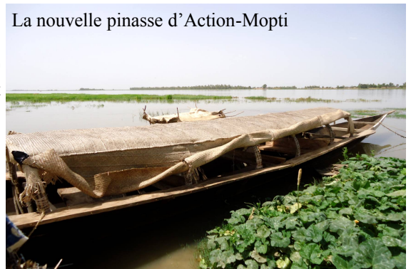
La nouvelle pinasse d'Action-Mopti

Au Mali, nous sommes soutenus par l'ONU Femmes, l'Unicef, Care et l'USAID.